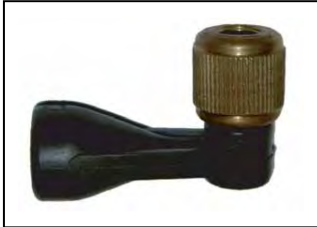
L'adaptateur en forme de L Quick-Clear Valve